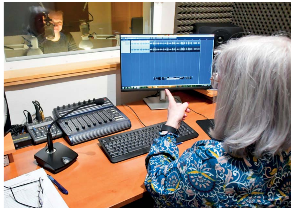
Načítání ve studiu je pečlivá práce, na kterou dohlíží režisérka.