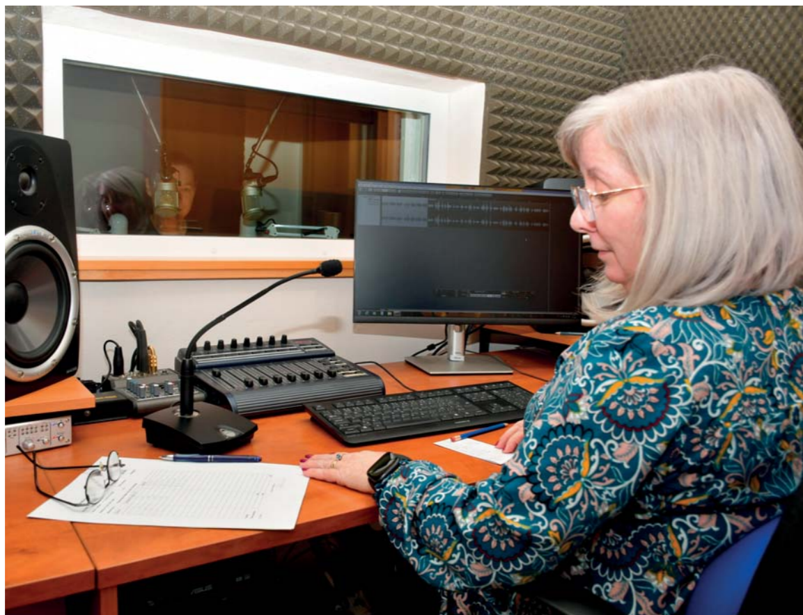
Časopisy, které profesionálně načtou ve studiu K. E. Macana, dostávají klienti třikrát měsíčně.

Monitor – nepřetržitě vychází už od roku 1993. Jde o společensko-kulturní zvukový časopis zaměřený