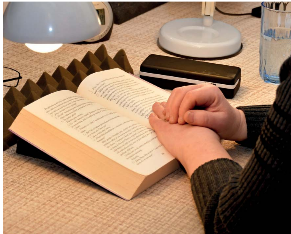
Zvuková knihovna Lumen Christi obsahuje převážně duchovní literaturu.

V knihovně jsem začala pracovat v 90. letech. Práce spočívala v půjčování knih a časopisů s duchovní tematikou nevidomým a slabozrakým lidem. Službu využívali také často ti, co přišli o zdravý zrak ve stáří. Lidé si této služby dost vážili, duchovní rozměr knih byl pro ně povzbuzující, byl pro ně do té doby málo dostupný. Často měli potřebu s námi sdílet své dojmy z knížek.