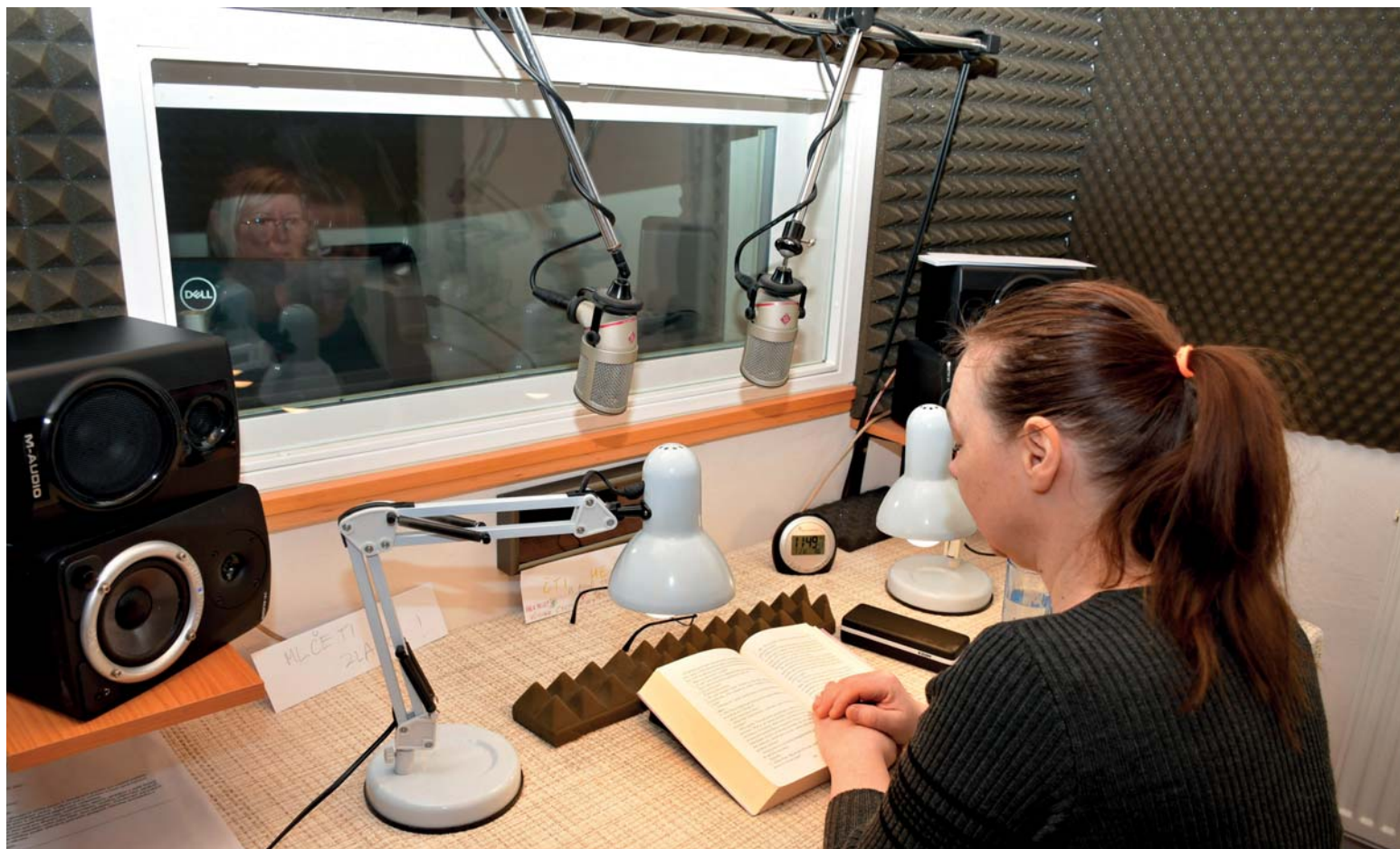
Část zvukových verzí knih a časopisů vzniká v nahrávacím studiu v centru Prahy.