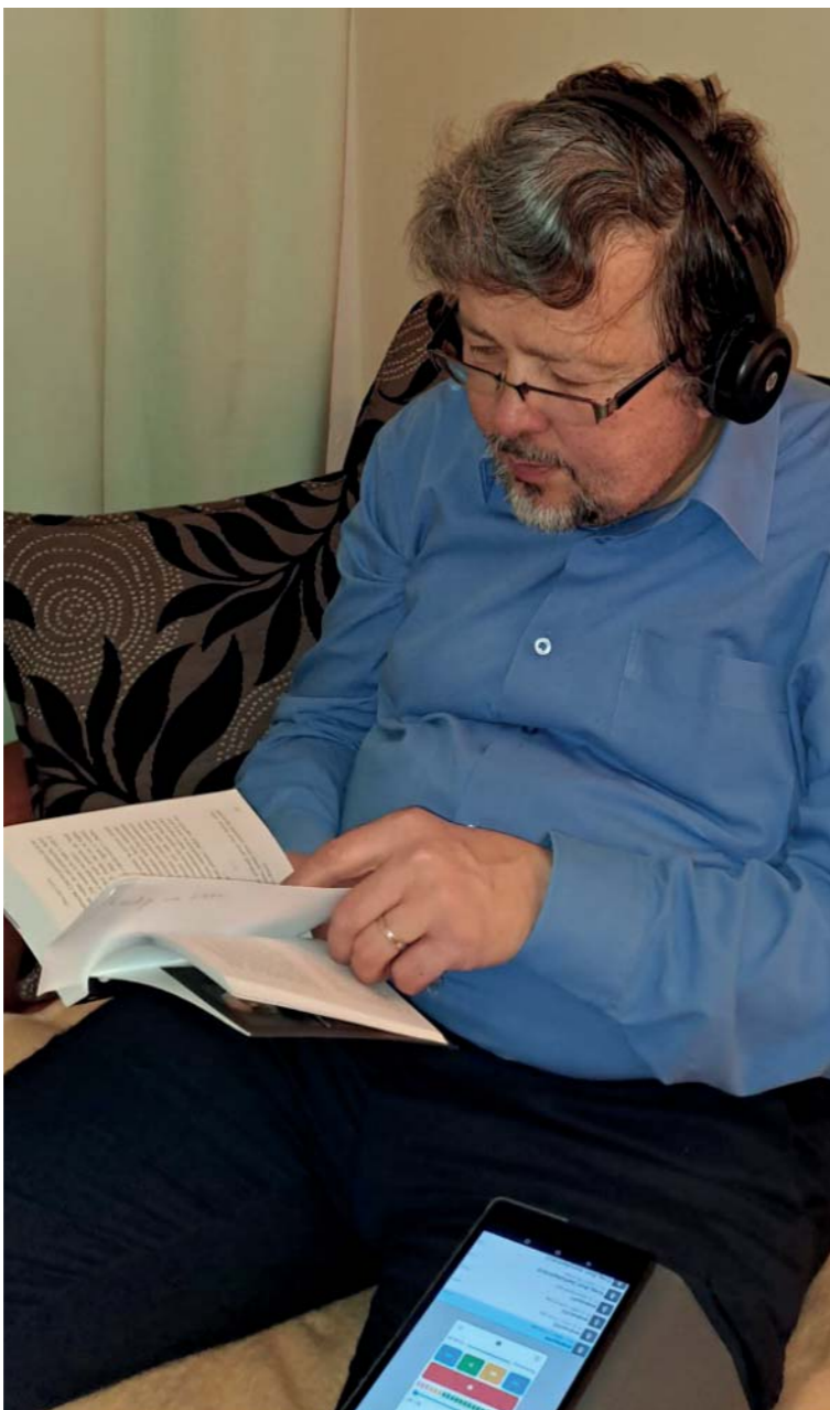
Přečíst si knihu a udělat tím dobrý skutek.

Je zvláštní tím, že vlastně nevíme, kdo bude audioknihou poslouchat, jestli ji vůbec někdo bude poslouchat, jak bude reagovat... Nemáme od posluchačů žádnou zpětnou vazbu a to je na tom to krásné a svým způsobem fascinující. Dozvíme se možná až jednou na věčnosti, zda načítání někomu pomohlo třeba v jeho samotě... Při každém načítání na případného posluchače můžeme myslet a duchovně se s ním setkat.