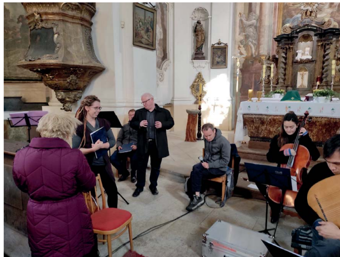
Musica pro Santa Cecilia během koncertu.

Vystupuje převážně v menších kostelech a komorních sálech, kde stará hudba nachází nejhodnější duchovní dimenzi.