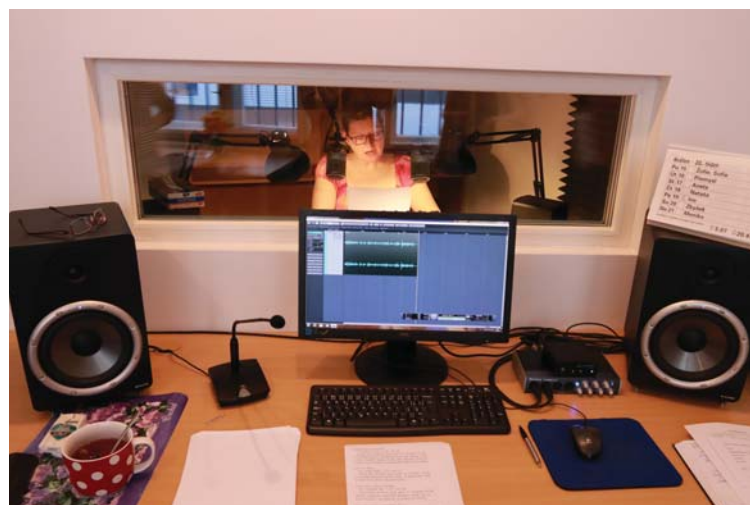
Počítač nahrávku zaznamenává, jeho obsluha může kontrolovat, zda je vše v pořádku jak na monitoru, tak pomocí poslechu z citlivých reproduktorů.