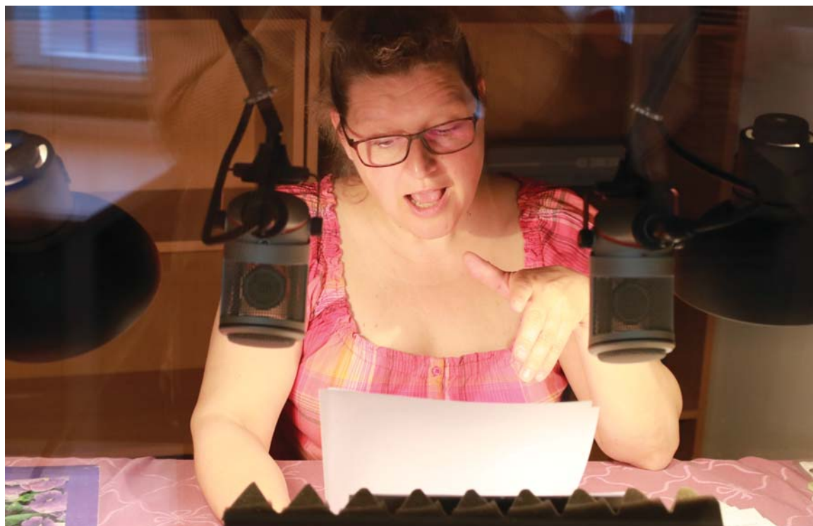
V nahrávacím studiu v centru Prahy vznikají zvukové knihy a časopisy. Více na str. 15.