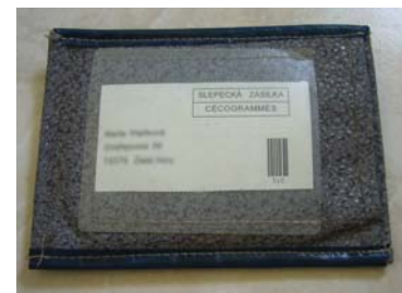
Pouzdro pro slepecké zásilky.