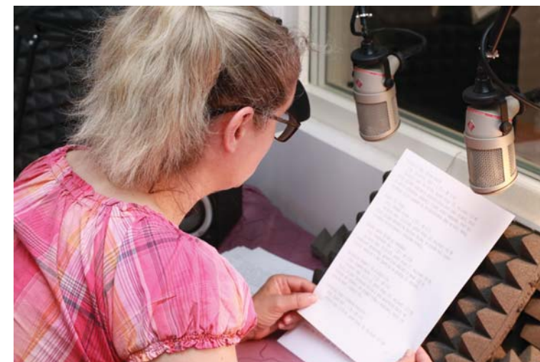
Vlastní nahrávání se odehrává ve zvukotěsné budce, citlivé mikrofony zajišťují kvalitní záznam hlasu.