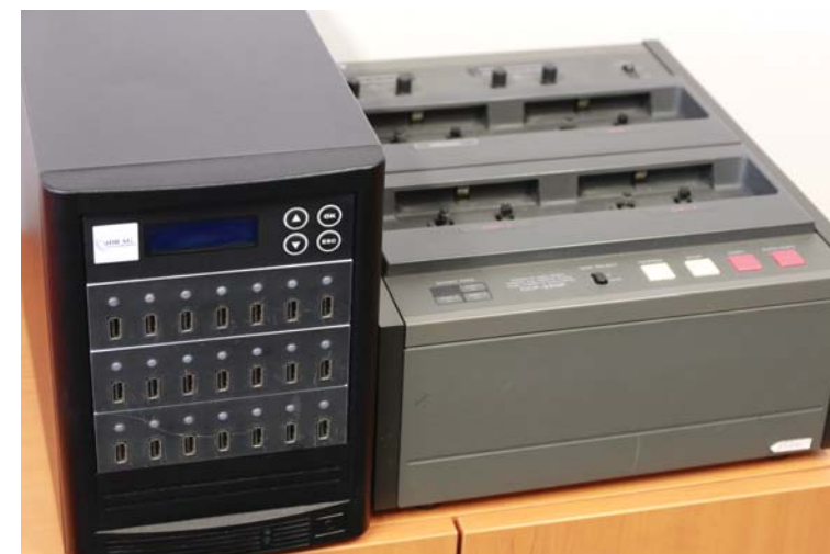
Historie a současnost. Vlevo je přístroj, který slouží ke kopírování usb disků, na kterých nevidomí nahrávky dostávají. Vpravo jeho kazetový předchůdce.