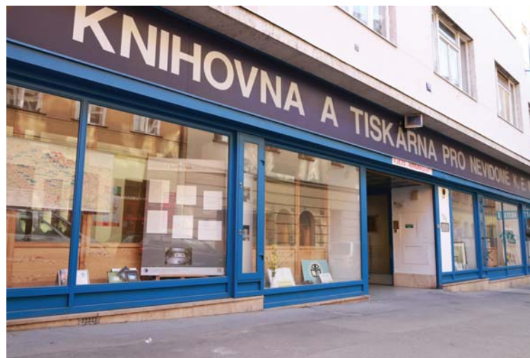
V ulici Ve Smečkách sídlí knihovna pro nevidomé už desítky let. Jsou tam i nahrávací studia, která Lumen Christi využívají.