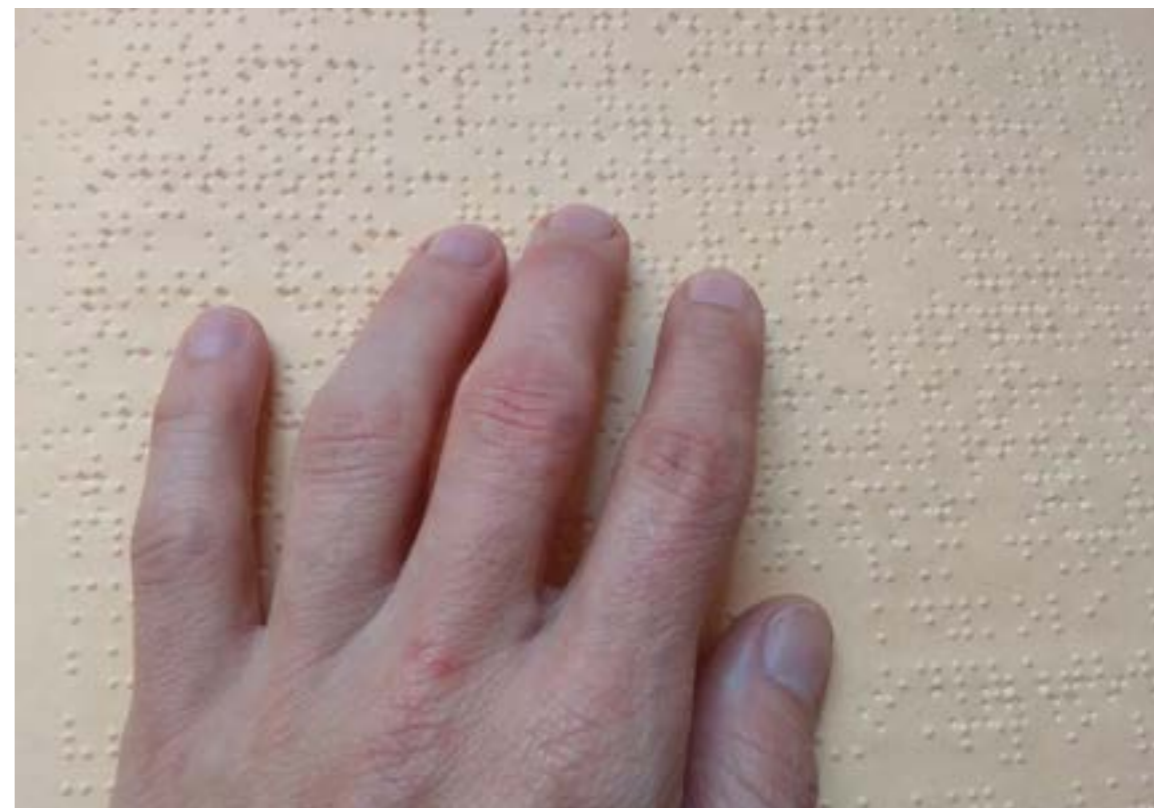
Braillovo písmo zpřístupnilo zrakově handicapovaným třeba i evangelium podle sv. Jana.

Literatura ji baví, a tak u ní doma zní zvukové knihy třeba i v kuchyni a při domácích pracích. „Ráda poslouchám i Čtení na pokračování v Radiu Proglas