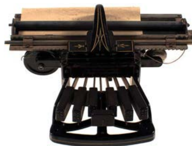
Pichtův psací stroj byl patentován roku 1901. Třicet let po smrti vynálezce slepeckého písma Louise Braillova pomohl jeho vynález do světa.