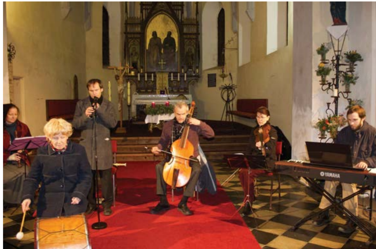
Soubor staré hudby Musica pro Sancta Cecilia při vystoupení.