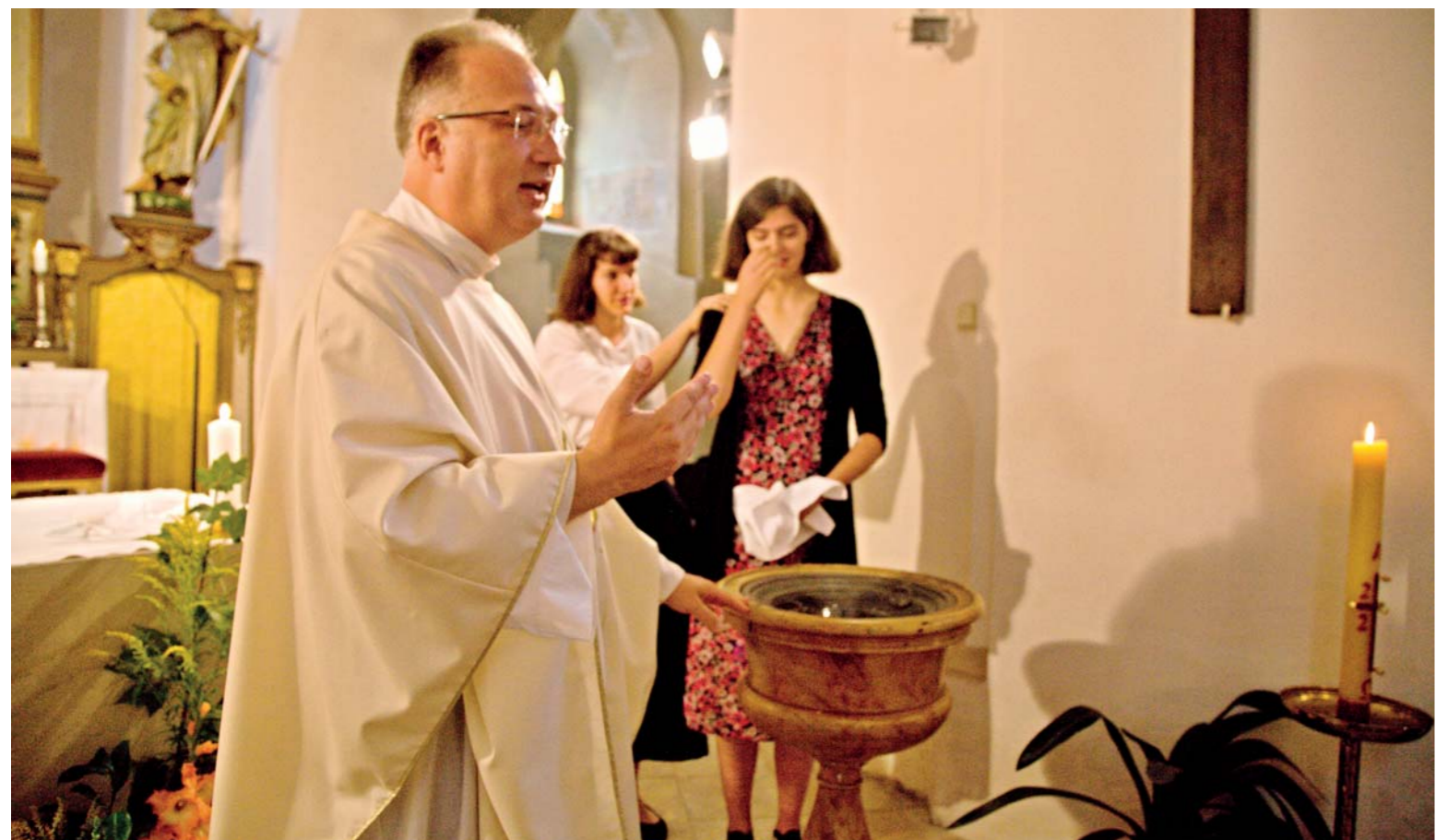
Paškál jako symbol Světla Kristova.