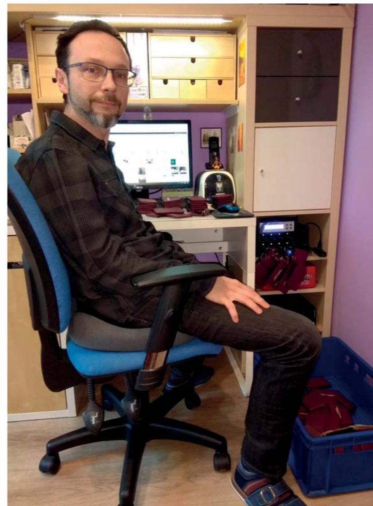
Přechod na práci z domova nám problém nedělal.

Na rozdíl od mnohých firem nám úplný přechod na práci z domova nedělal problém. Už před lety, kdy jsme z úsporných důvodů přestěhovali zvukovou knihovnu z Prahy do Hostivice, jsme zjistili, že řadu činností lze vykonávat z domova. Všichni tři zaměstnanci knihovny proto už měli svá do-